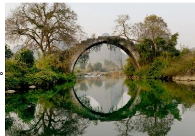
『陽朔 - 富裡橋』

『富裡橋』：位於桂林市陽朔縣白沙鎮遇龍橋碼頭，築於明代，距今約幾百年曆史。富里橋橫跨烏龜河，河水非常平緩，有大塊青石砌成的橋與水中倒影恰似一滿月，橋兩頭有兩株古樹守衛。