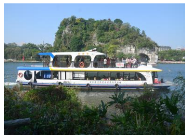
『乘船漫遊「一江四湖」』

『象鼻山』：位於桂林市內桃花江與漓江匯流處，被人們稱為桂林山水的象徵。它形似一頭鼻子伸進漓江飲水的巨像，構成「象山水月」奇景。